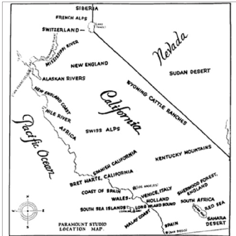
Figura 1. Paramount Studio Location Map, riportata in Balio (1985: 202).

Si pensi alla misattribuzione e se ne confronti il concetto con la mappa delle location californiane della Paramount (anni Venti, fig. 1), che indica i luoghi nei quali quella major riproduceva in esterni le ambientazioni di quasi ogni parte del mondo: