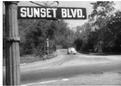
Figure 2-3. Viale del tramonto (Billy Wilder, 1950).

L’inclusione in un neo-noir come Black Dahlia della grande scritta “Hollywoodland” sulle colline della città potrebbe rappresentare allora un simile elemento al contempo indicale e autoriflessivo, un altro “designatore rigido” (fig. 4). 12 Se non fosse che a rendere ancora più complicato il gioco tra rappresentazione e referente geografico c’è il fatto che il film di De Palma è stato girato in Bulgaria. E che quelle colline sono verosimilmente le propaggini del massiccio di Vitoša, pochi chilometri a sud di Sofia.